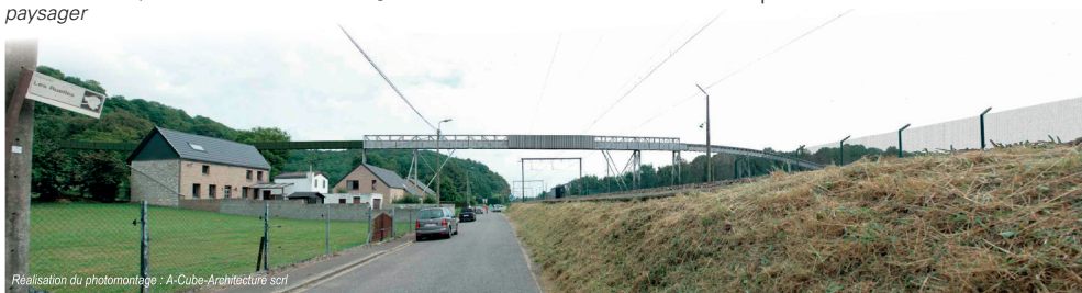
Réalisation du photomontage : A-Cube-Architecture scrl

Les cendres seront extraites au moyen d'engins de terrassement classiques (une pelle hydraulique et deux camions de chargement) en commençant par les extrémités en amont du terril et en progressant vers l'aval. Pour assurer la stabilité, une modélisation complète des diverses étapes des travaux a été réalisée en coordination avec plusieurs bureaux d'études.